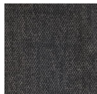
704 - Route