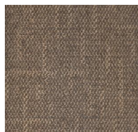
701 - Fairway