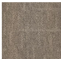
700 - Avenue