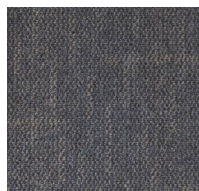
702 - Lane