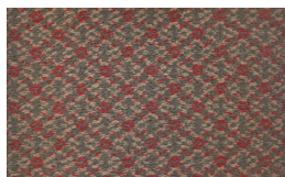
552 - Presidential