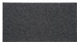
102 - Phantom