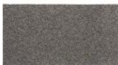
101 - Khaki