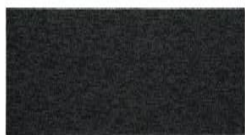
103 - Seal