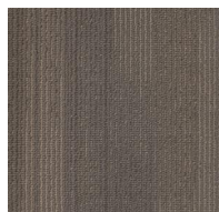
006 - Capricorn