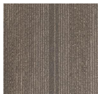
005 - Leo