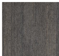
004 - Aquarius