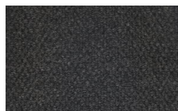
805 - Grey