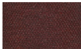
802 - Red