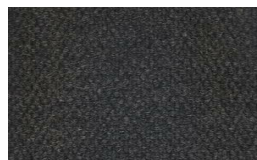
805 - Grey