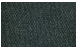
803 - Green