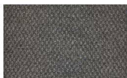
807 - Mist