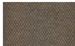
806 - Bege