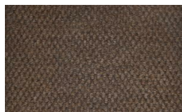
800 - Lever