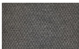
807 - Mist