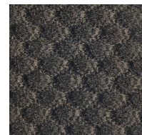
125 - Black