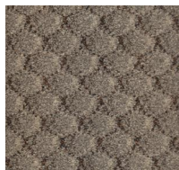
120 - Beige