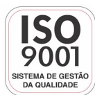
Empresa Certificada ISO 9001:2008