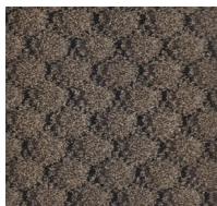
122 - Brown