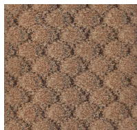
121 - Ginger