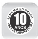
Selo de garantia de performance