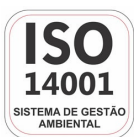
Empresa Certificada ISO 14001:2004