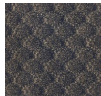
124 - Blue