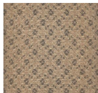
551 - Golden