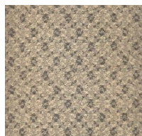
550 - Ambar