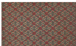
552 - Presidential