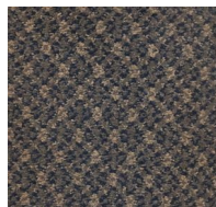
553 - Royal Blue