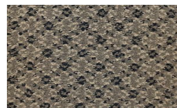
554 - Black Diamond