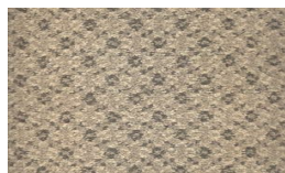
550 - Ambar