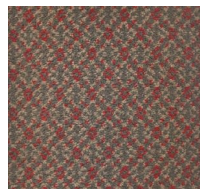
552 - Presidential