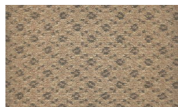
551 - Golden