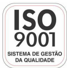
Fabricante Certificada ISO 9001:2008