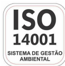
Fabricante Certificada ISO 14001:2004